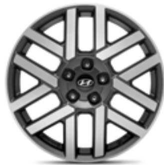
Llanta de aleación de 18", Honam P7400ADE08BC