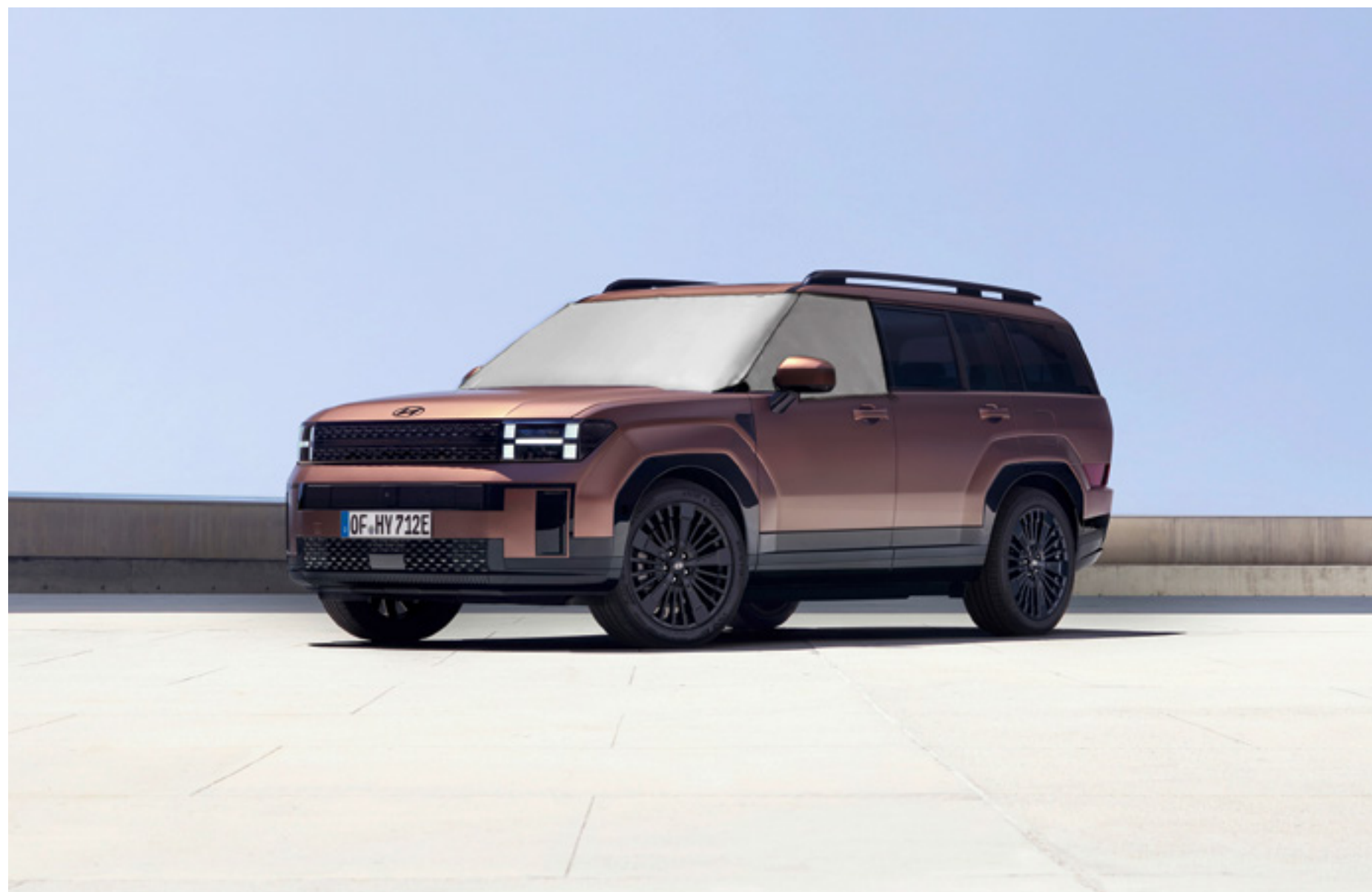
Funda protectora para el parabrisas, P7723ADE00