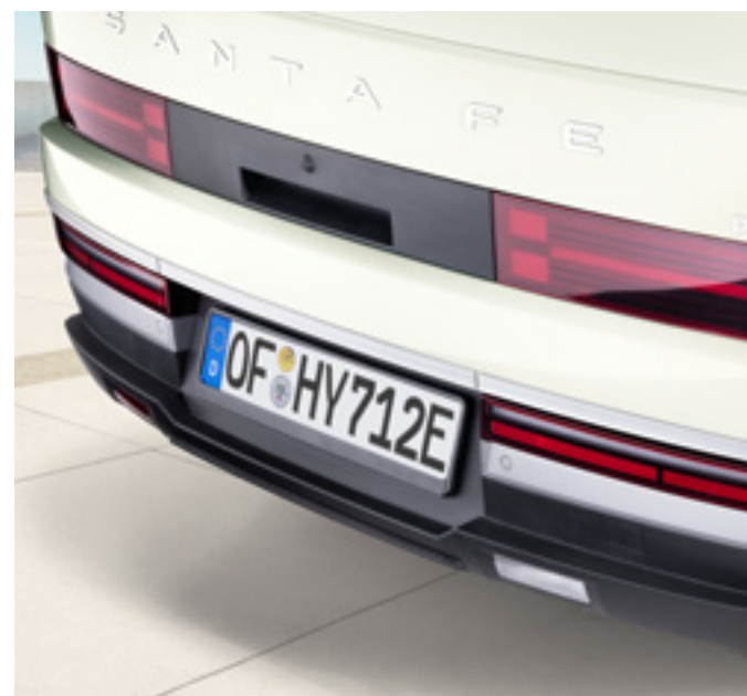
Moldura embellecedora cromada portón trasero, P7491ADE00CL