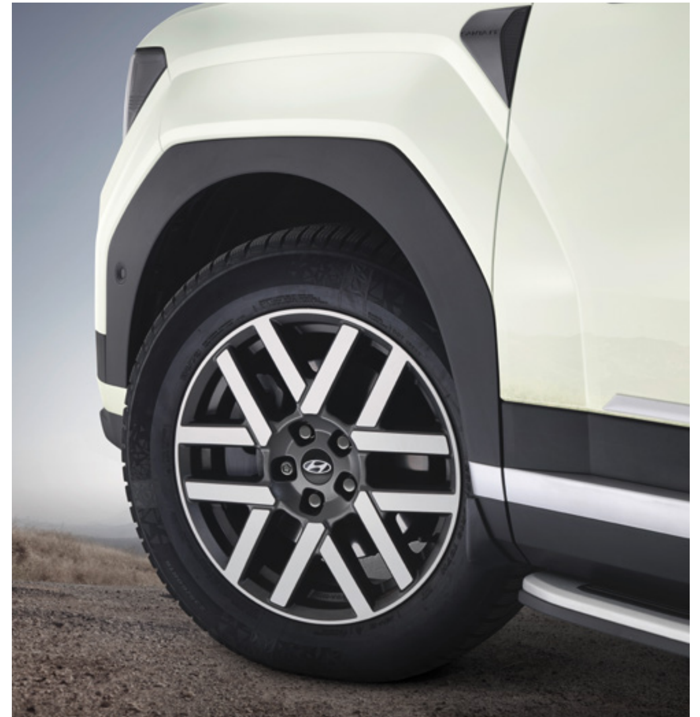
Tuercas antirrobo, cromo oscuro, 99490ADE50DC