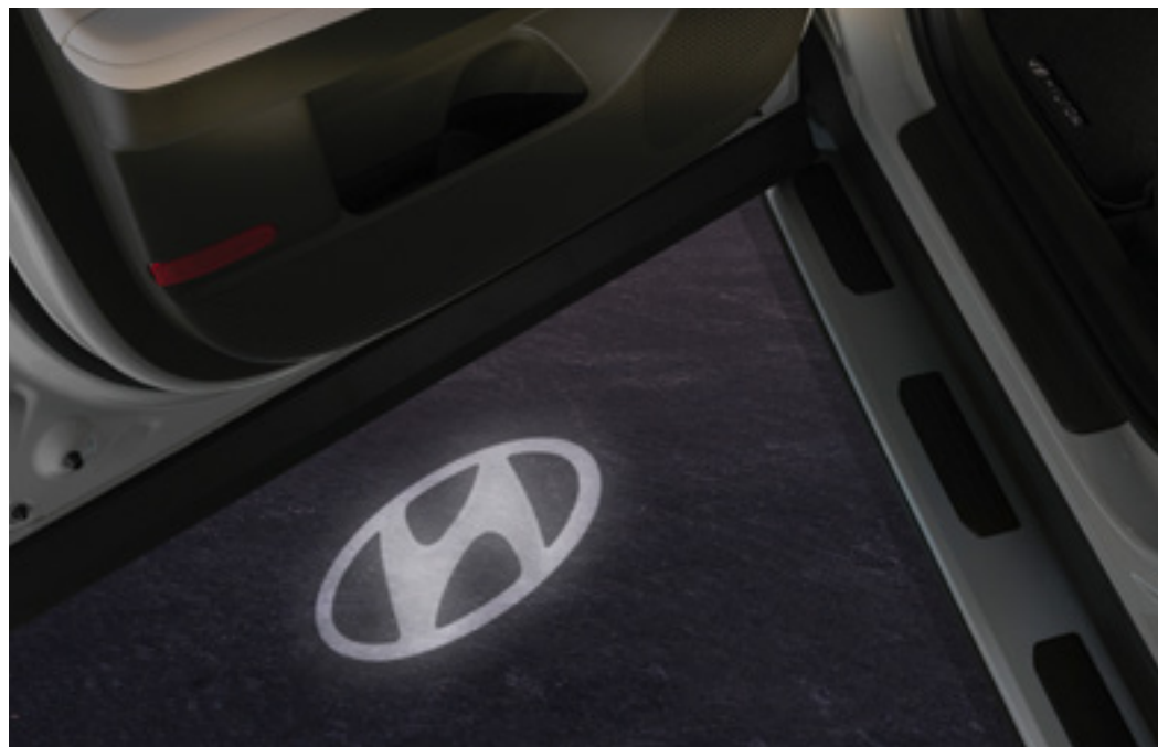
Set iluminación inferior puerta, logotipo Hyundai, 99651ADE00H

Gracias al set de iluminación para la parte inferior de las puertas delanteras y a las luces LED del portón trasero, no volverás a pisar donde no debes al salir de noche de tu SANTA FE ni a buscar a ciegas en el maletero.