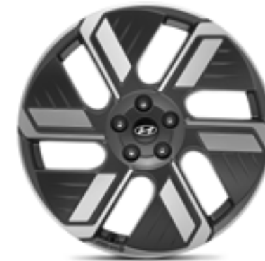
Llanta de aleación de 20", Anam P7400ADE20BC