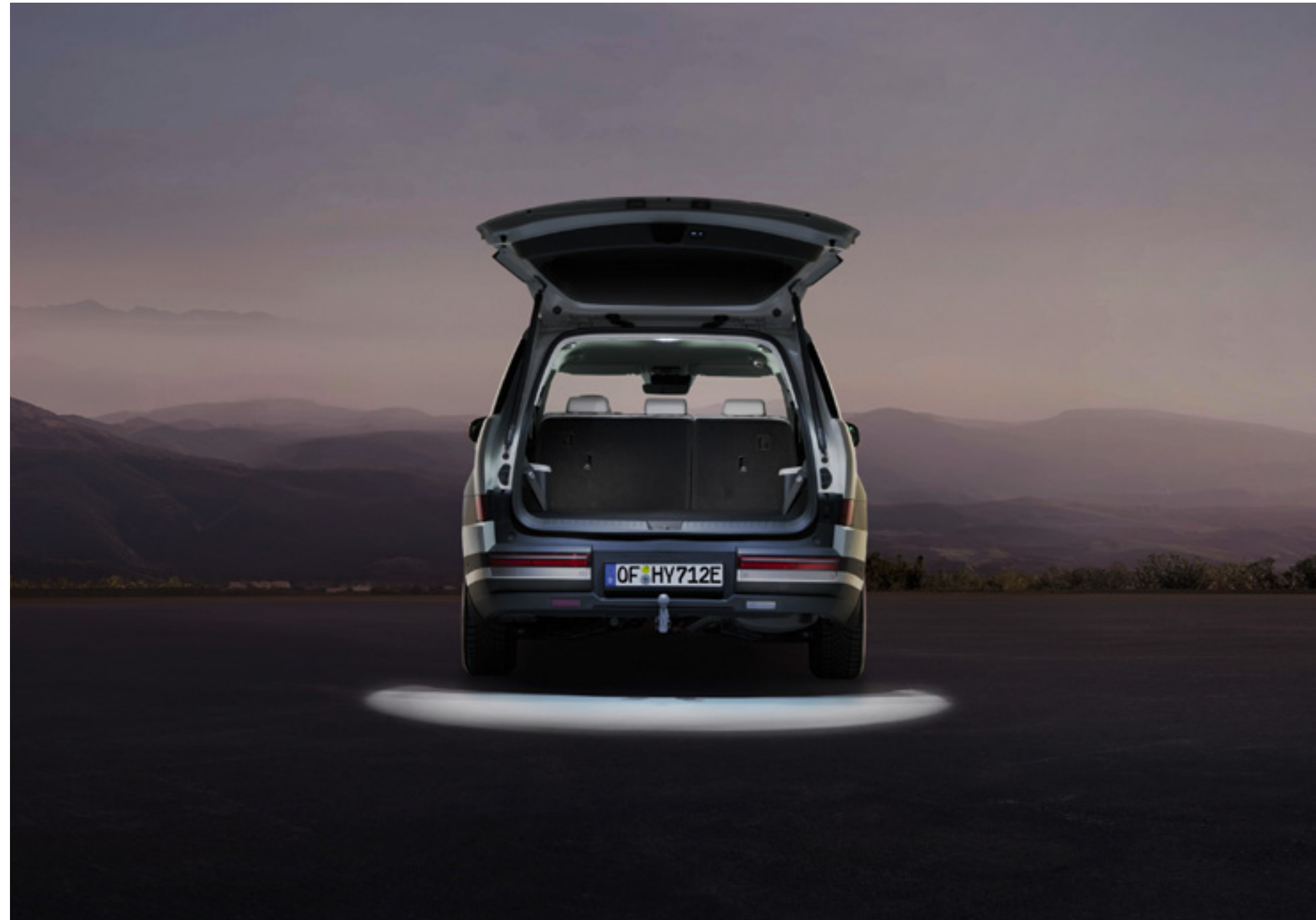
Set iluminación portón trasero, 99652ADE00