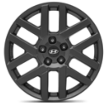
Llanta de aleación de 18", Honam P7400ADE08GR