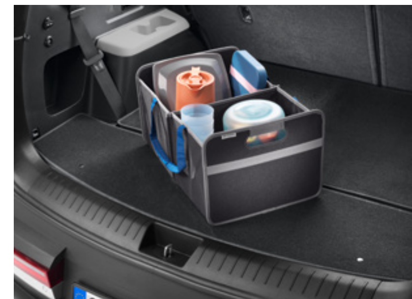
Organizador de maletero, plegable, 99123ADE00

Olvídate de asarte de calor dentro del coche. Olvídate de tener que rascar el hielo en invierno. Y olvídate también de llevar los objetos sueltos por el maletero.