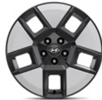
Llanta de aleación de 18" P7F40AK010