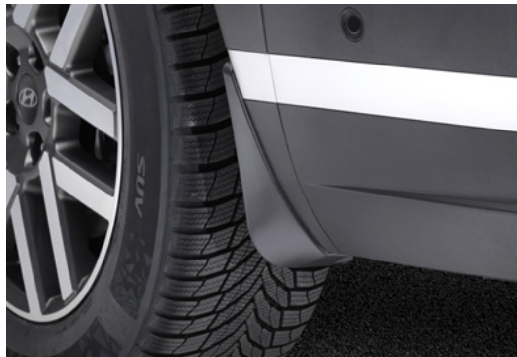
Set de guardabarros traseros, R6F46ACF00EU