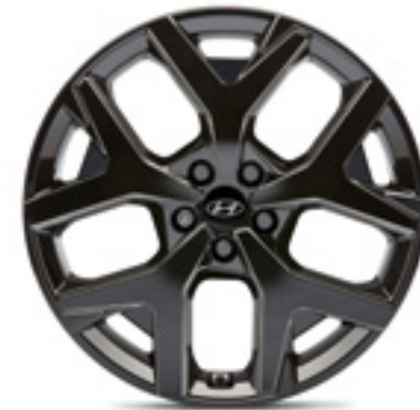
Llanta de aleación de 20", Donam P6F40AC000