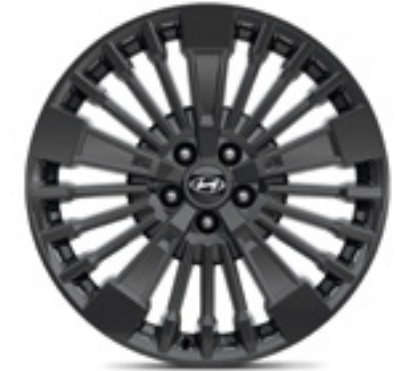
Llanta de aleación de 20" P7F40AK020