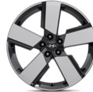
Llanta de aleación de 20" P6F40AK040