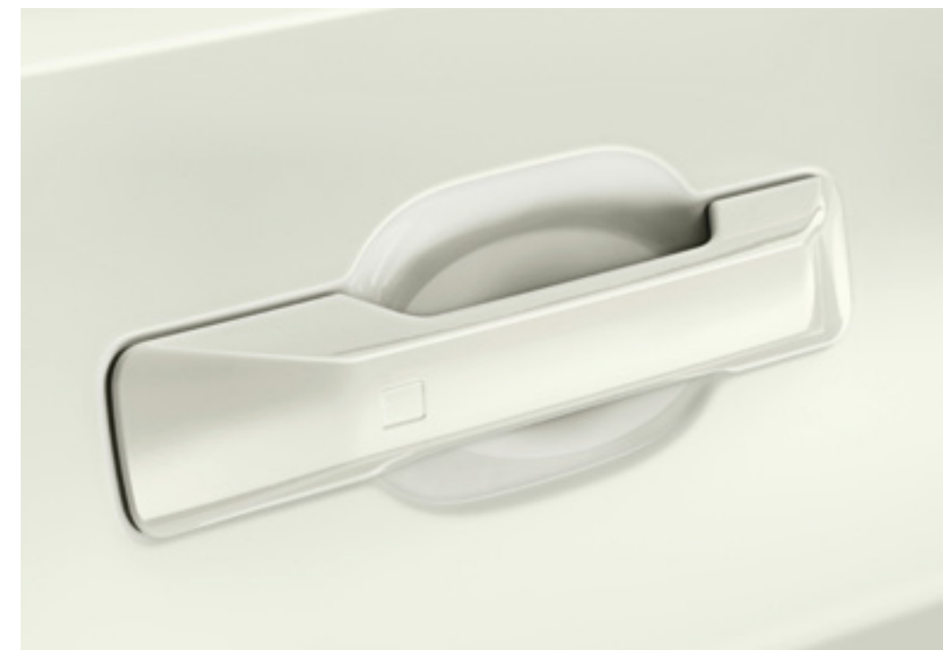
Set adhesivos protector manillas, 99272ADE00