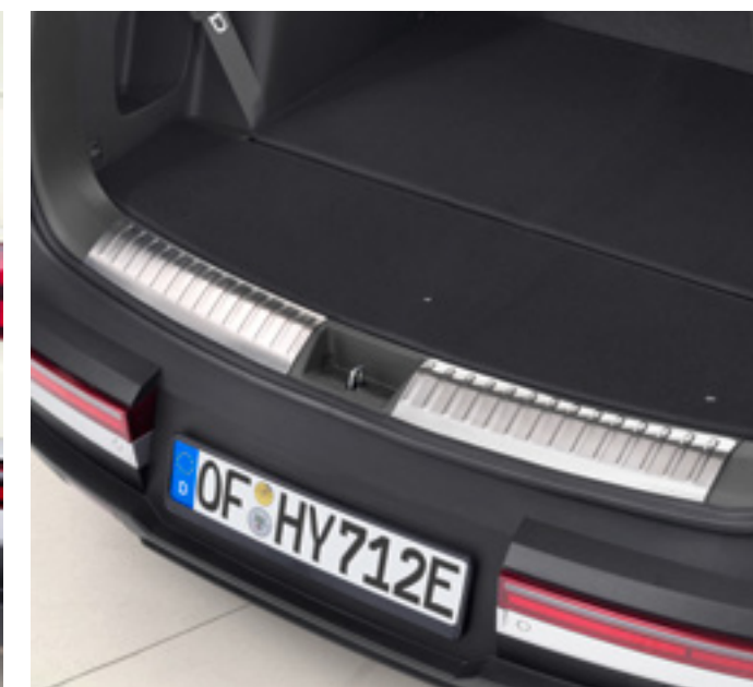
Moldura protectora apertura portón trasero, P7275ADE00BR