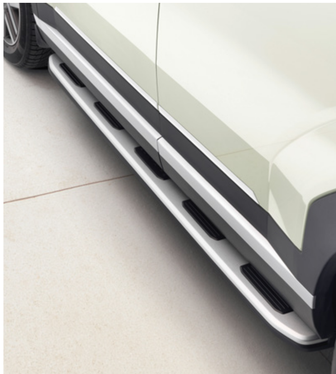
Estriberas laterales, deportivas, P7F37AC000