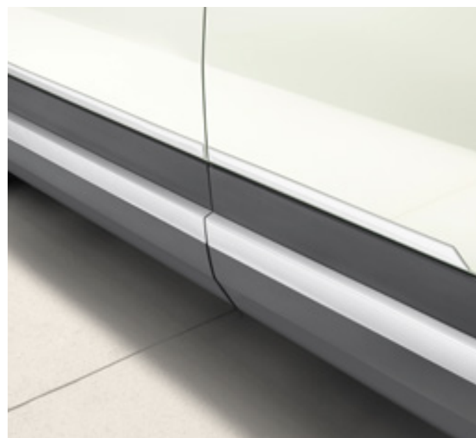
Set de molduras laterales para puertas, P7271ADE00CL