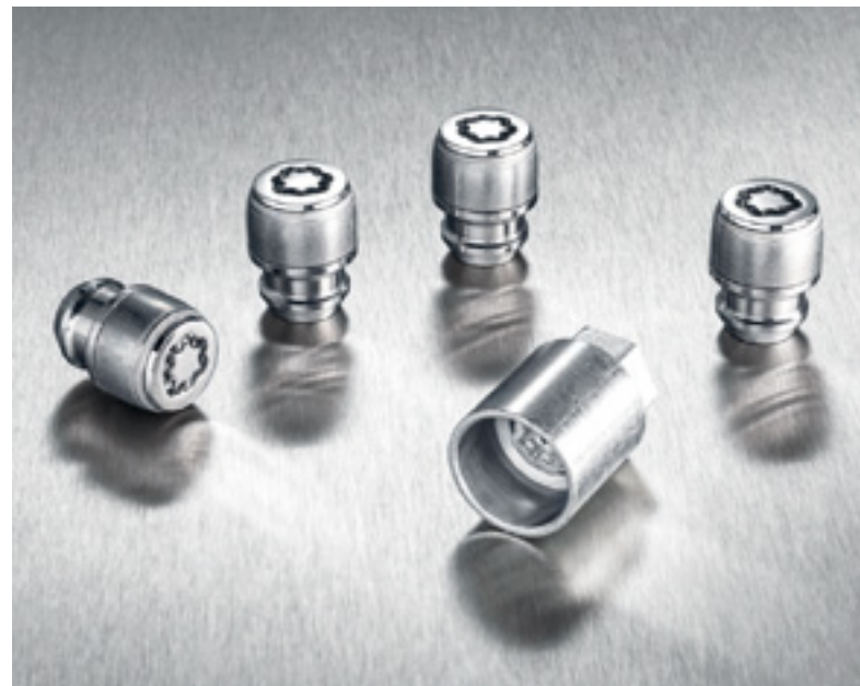
Tuercas antirrobo, 99490ADE51

Llantas originales personalizadas para una amplia gama de estilos. Tómate tu tiempo antes de decidirte. Sabemos que harás la elección perfecta.