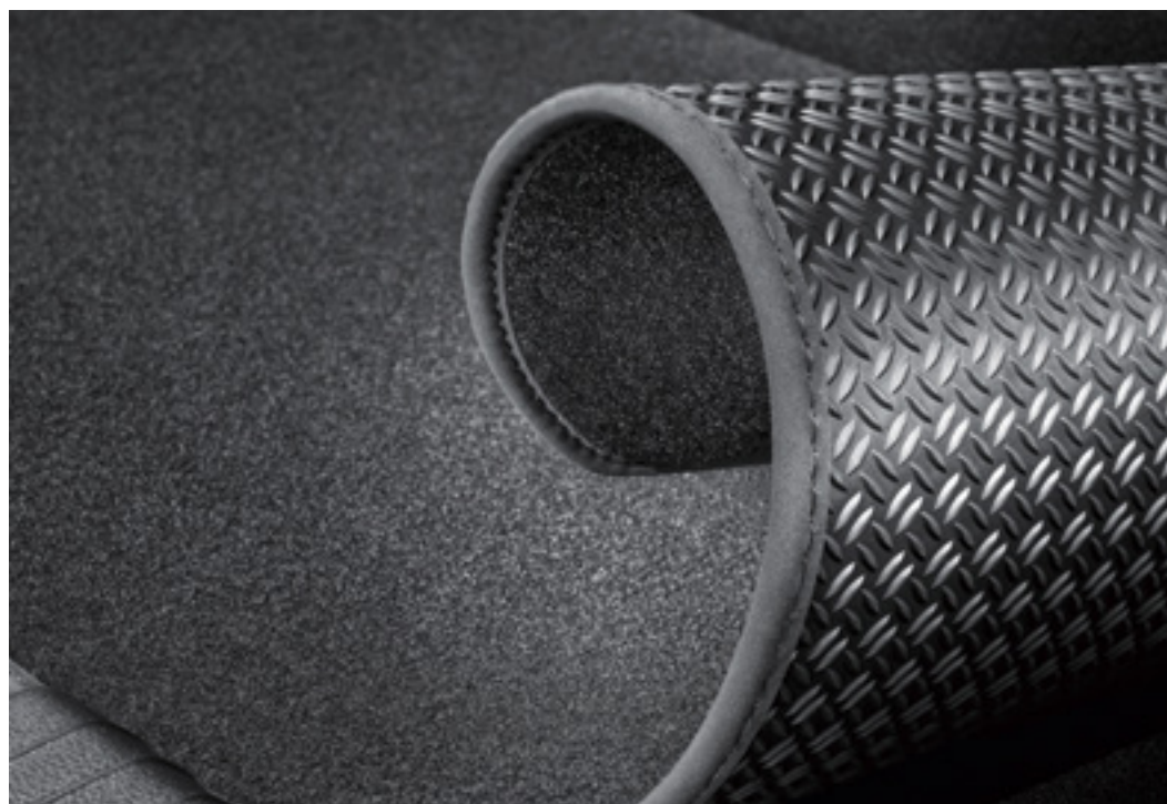
Alfombrilla reversible antideslizante para el maletero, P7120ADE00E

Podrás encontrar todo tipo de accesorios para mantener tu SANTA FE en perfecto estado: desde el set de guardabarros hasta el set de adhesivos para proteger las manillas.